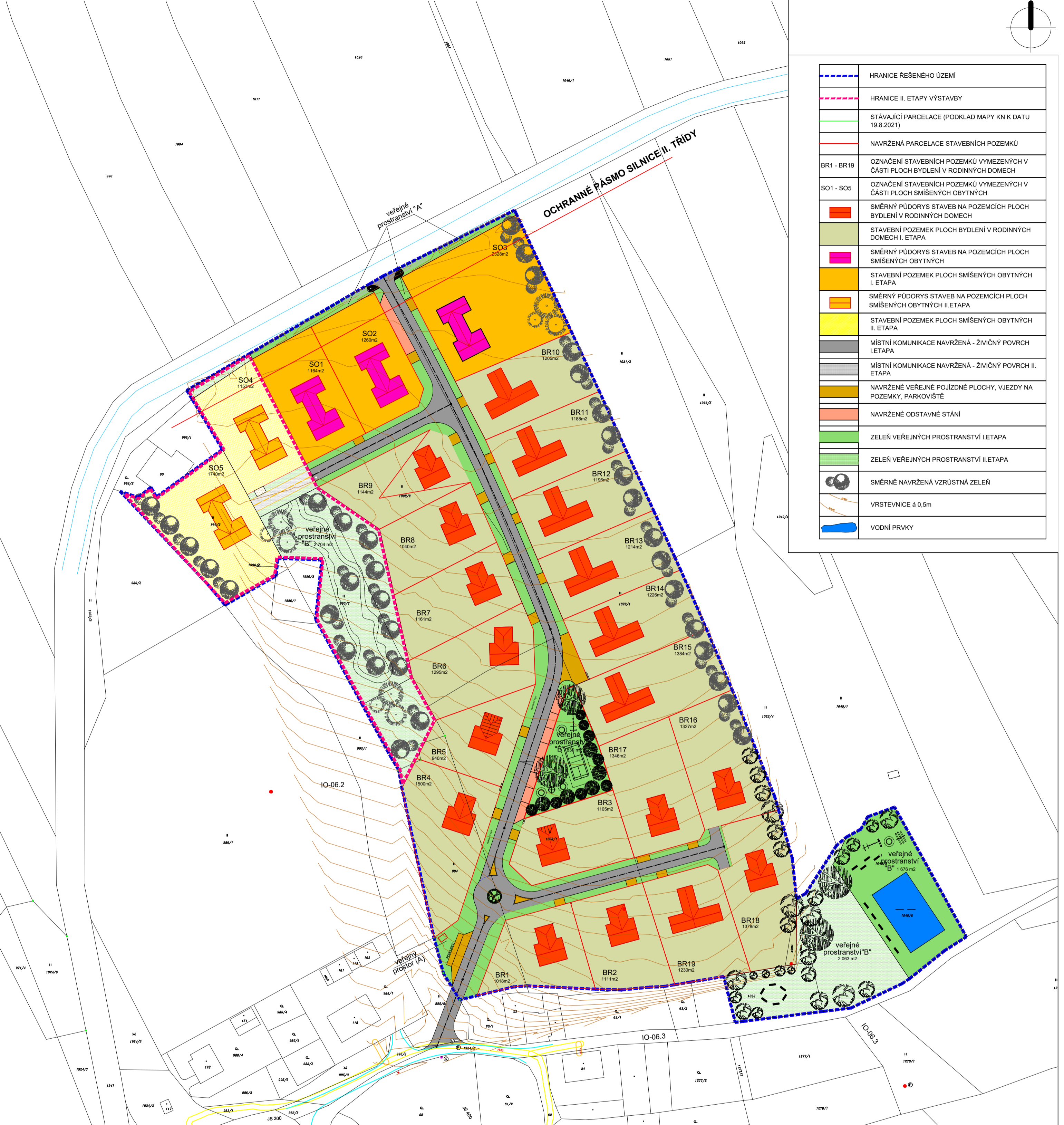
TABULKA STAVEBNÍCH PARCEL